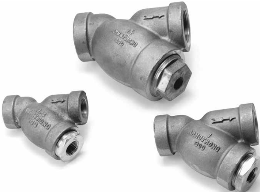
Tabelle S-330-1. Werkstoffe: 300 lb Muffengewinde 1/2" - 2"